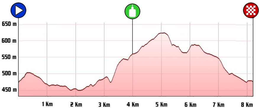
Profilo altimetrico (8,2 Km)

Seguici su: Corsa Podistica Lana, boschi e lavatoi